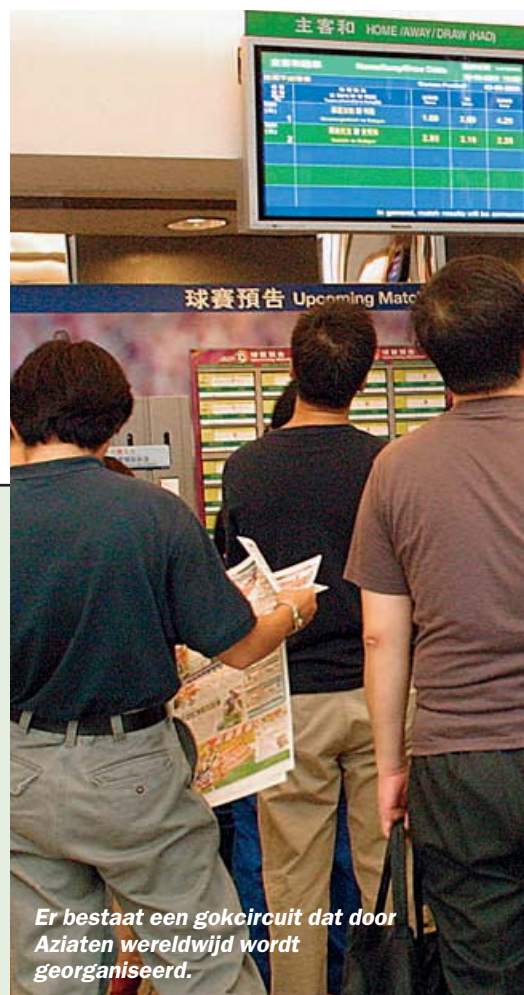
Er bestaat een gokcircuit dat door Aziaten wereldwijd wordt georganiseerd.