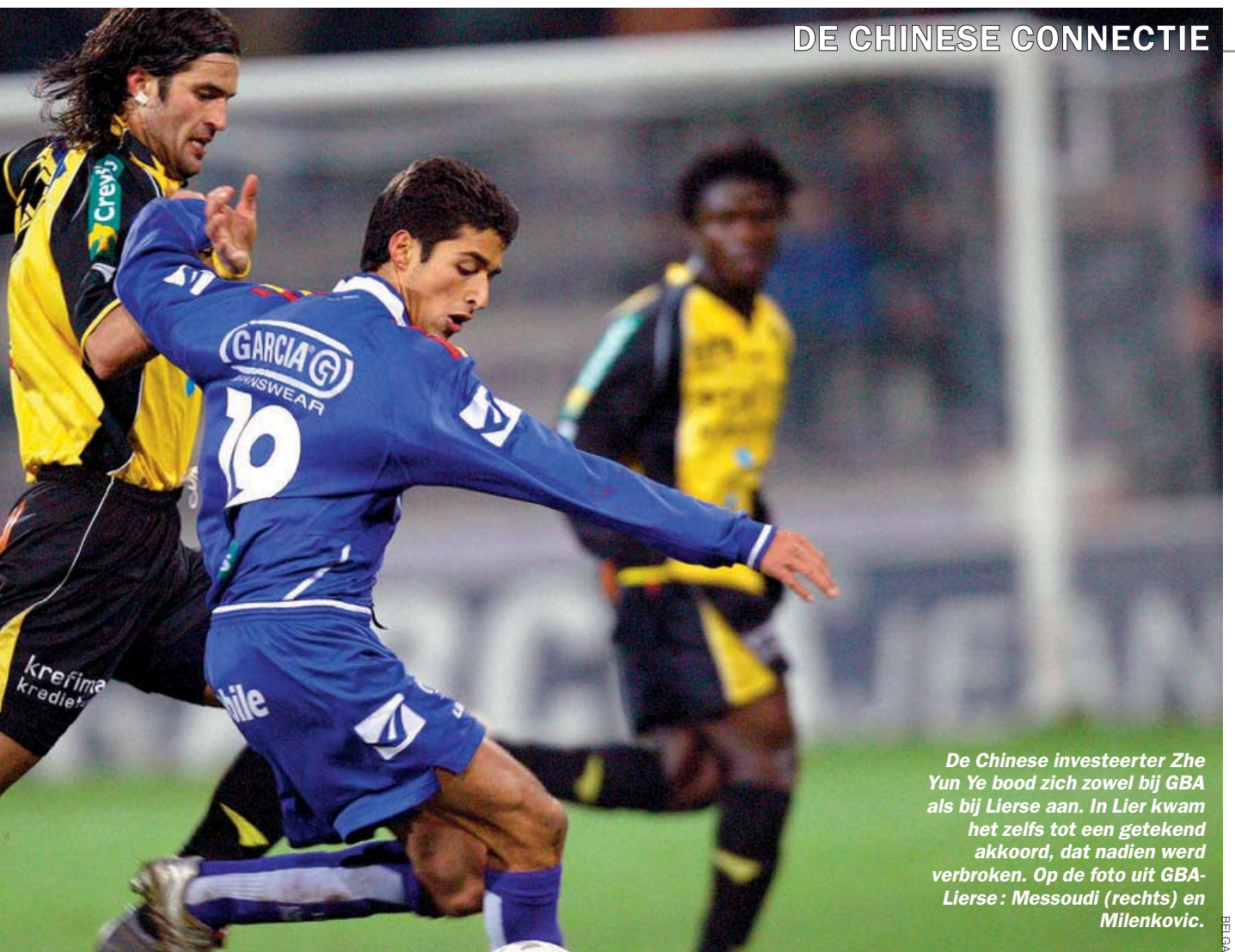
De Chinese investeerder Zhe Yun Ye bood zich zowel bij GBA als bij Lierse aan. In Lier kwam het zelfs tot een getekend akkoord, dat nadien werd verbroken. Op de foto uit GBA-Lierse: Messoudi (rechts) en Milenkovic.